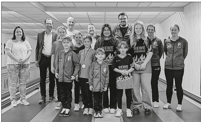
Unsere Jugend und die Trainer mit den Sponsoren

Wir möchten uns bei unseren Sponsoren VR-Bank Ostalb eG, Pfeiffer & May, ASTRA Straßen- und Tiefbau sowie Grund Fensterbau GmbH & Co. KG für ihre großzügige Unterstützung bedanken. Ohne sie wäre dieses Wochenende mit Unterkunft, Verpflegung und Reisekosten nicht möglich gewesen. Unsere Jugendlichen, Trainer und die gesamte Abteilung sind sehr dankbar für diese Hilfe und freuen sich auf kommende Wettbewerbe.